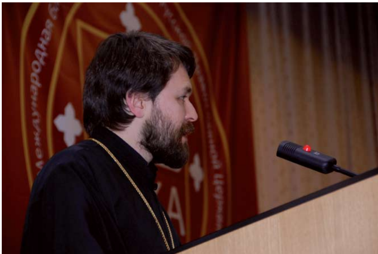
Епископ Венский и Австрийский Иларион