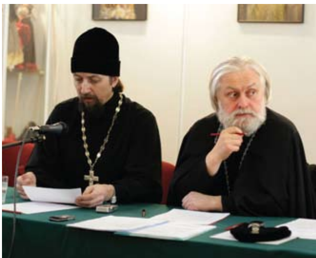
прот. Максим Козлов и архиеп. Верейский Евгений