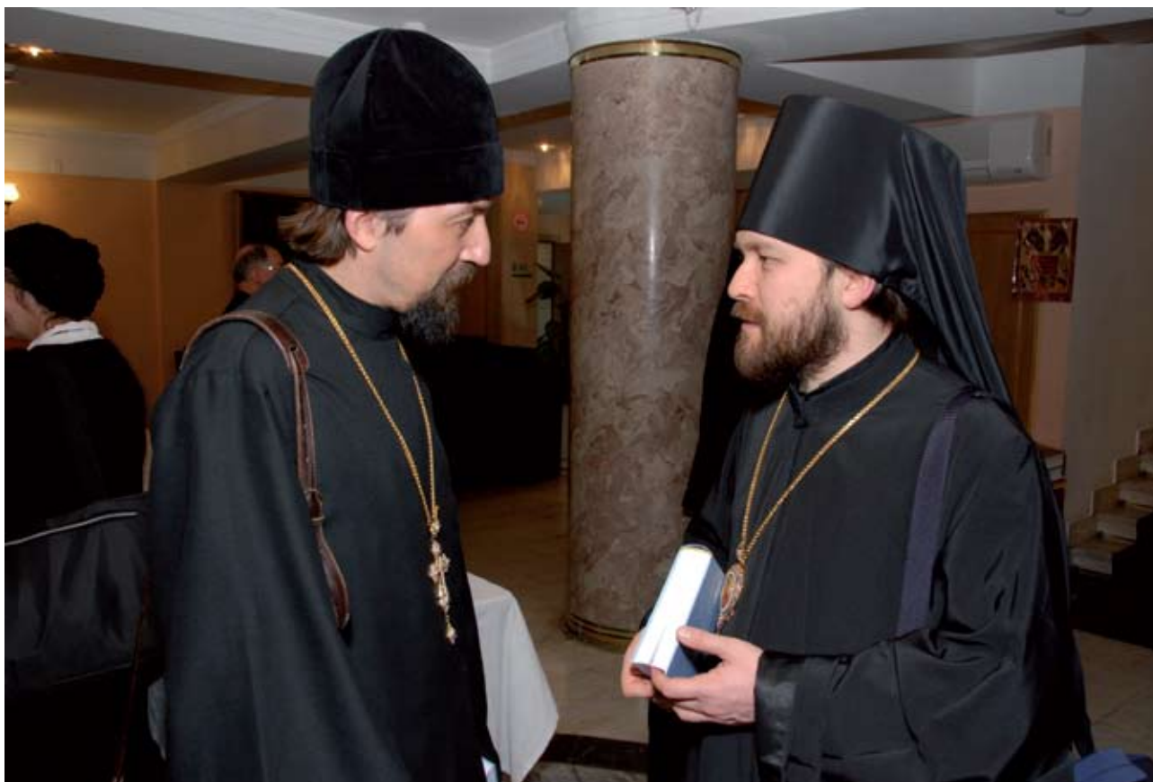
Прот. Максим Козлов и еп. Венский и Австрийский Иларион