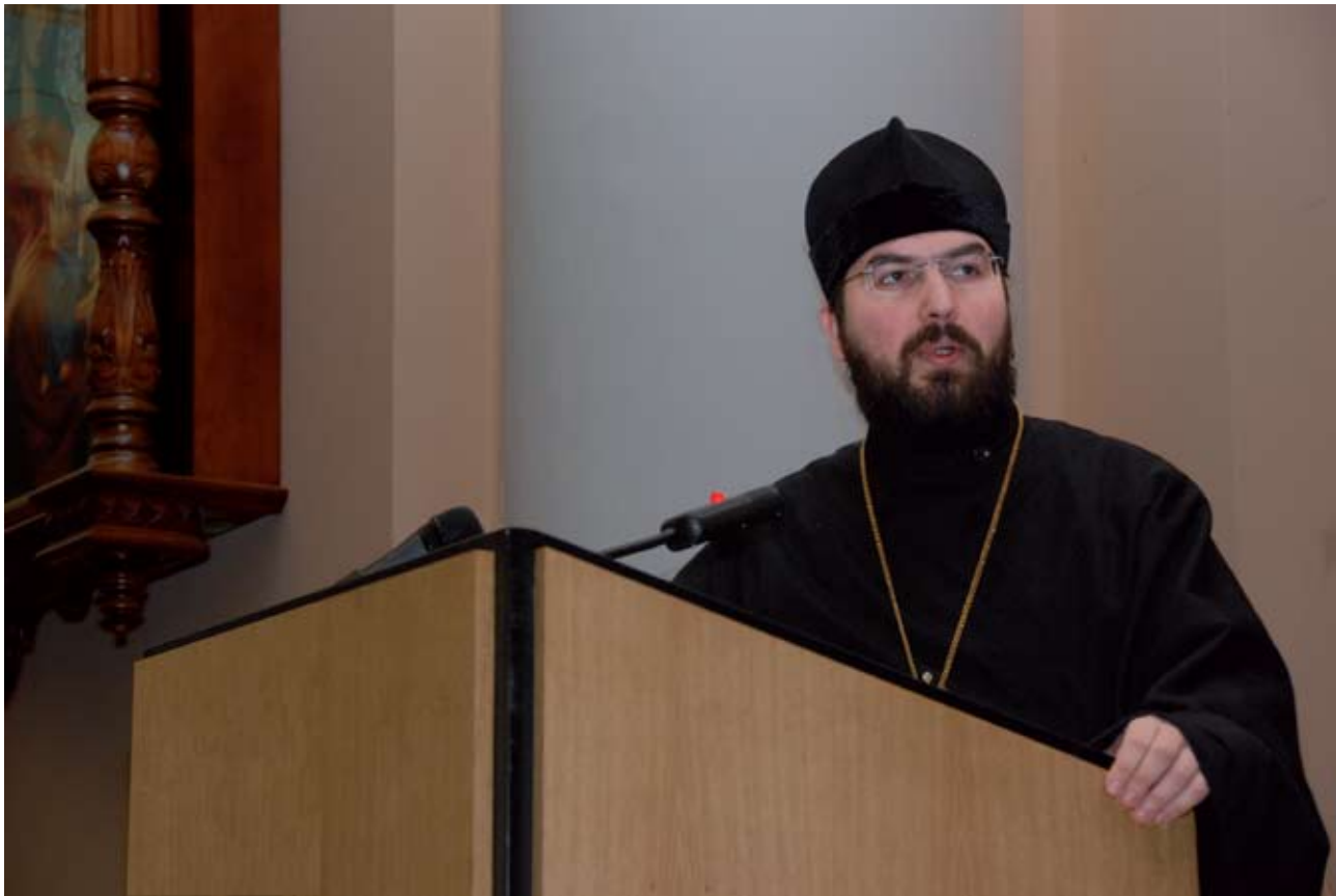
Епископ Бобруйский и Быховский Серафим