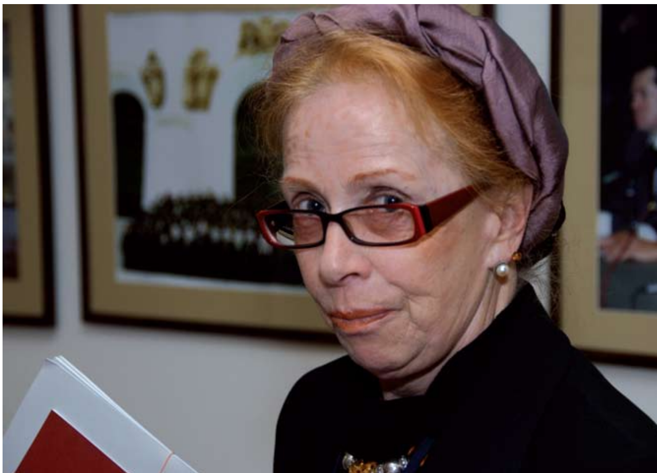
Проф. Габриелле Винклер

послужили усугублению разделения между Восточной и Западной Церквами. В докладе было ярко представлено учение преподобного Никиты Стифата.