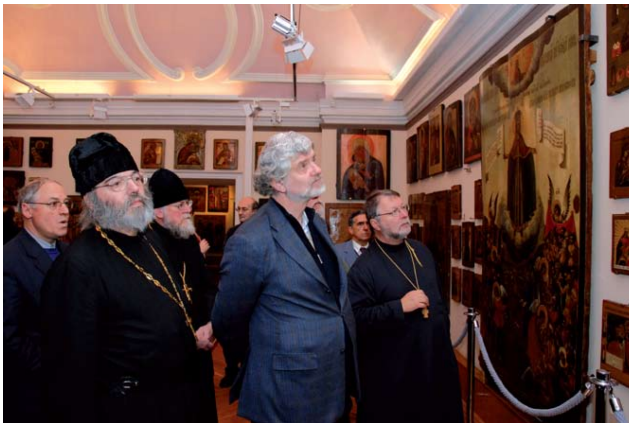
Экскурсия по Церковно-археологическому кабинету Московской духовной академии