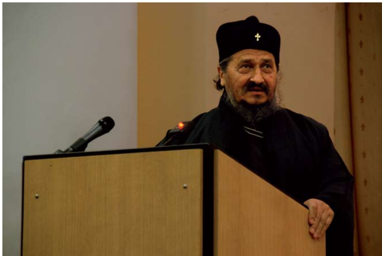
Епископ Афанасий (Евтич)

Далее были зачитаны доклады, посвященные учению о таинствах у восточных и западных отцов Церкви разных эпох: «Учение о Евхаристии и других таинствах в творениях великих Каппадокийцев» (П.Б. Михайлов, научный сотрудник Институ-