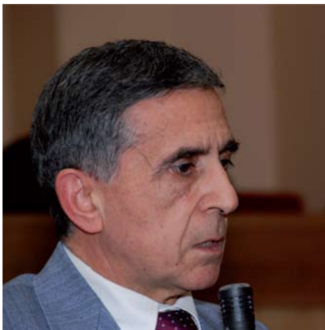
Проф. Иван Желев

ли никому повелений воздерживаться от брака. В последовавшей дискуссии обсуждался вопрос о смешанных браках, а также трудности, связанные с их пастырским окормлением.