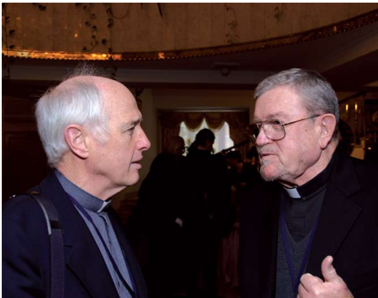
Проф. Поль де Клерк и проф. Роберт Тафт