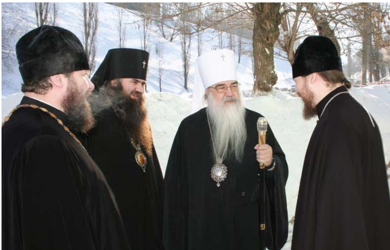
Архиепископ Нижегородский и Арзамасский Георгий и митрополит Минский и Слуцкий Филарет во дворе Нижегородской духовной семинарии