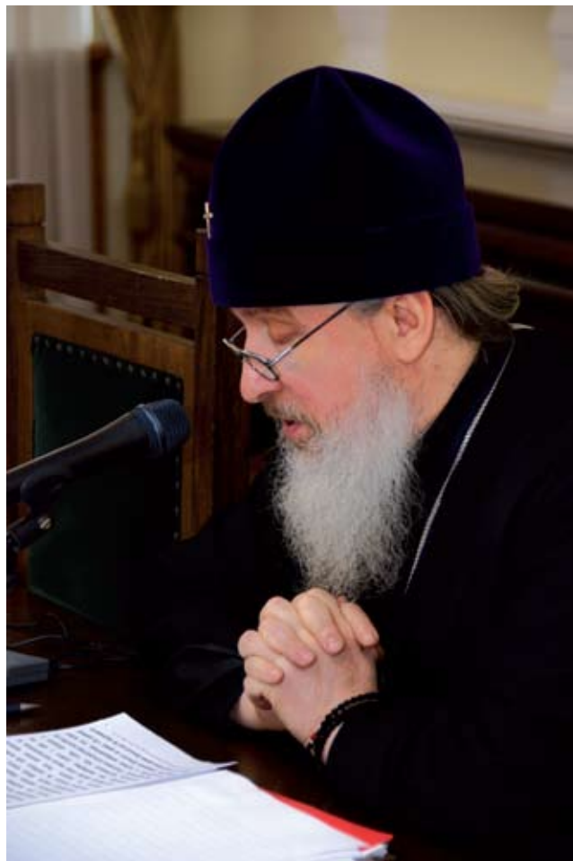
Архиепископ Тобольский и Тюменский Димитрий

В докладе А.А. Ткаченко (ИВИ РАН; ЦНЦ «Православная энциклопедия»; МДА; ПСТГУ) «Врачевальное помазание елеем в раннехристианской традиции: модели интерпретации» рассматривались истоки христианской практики использования елея для помазания недугующих.