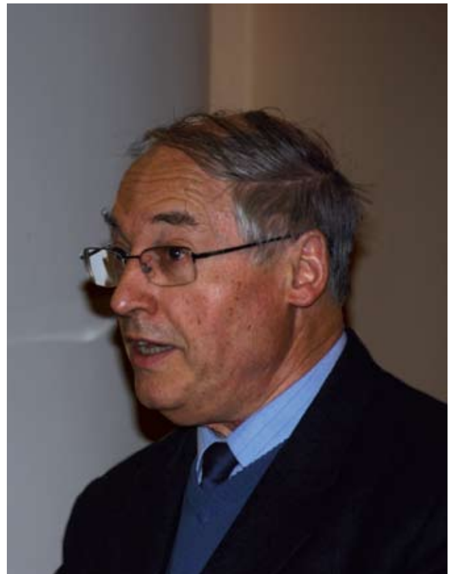
Проф. Марсель Метцгер