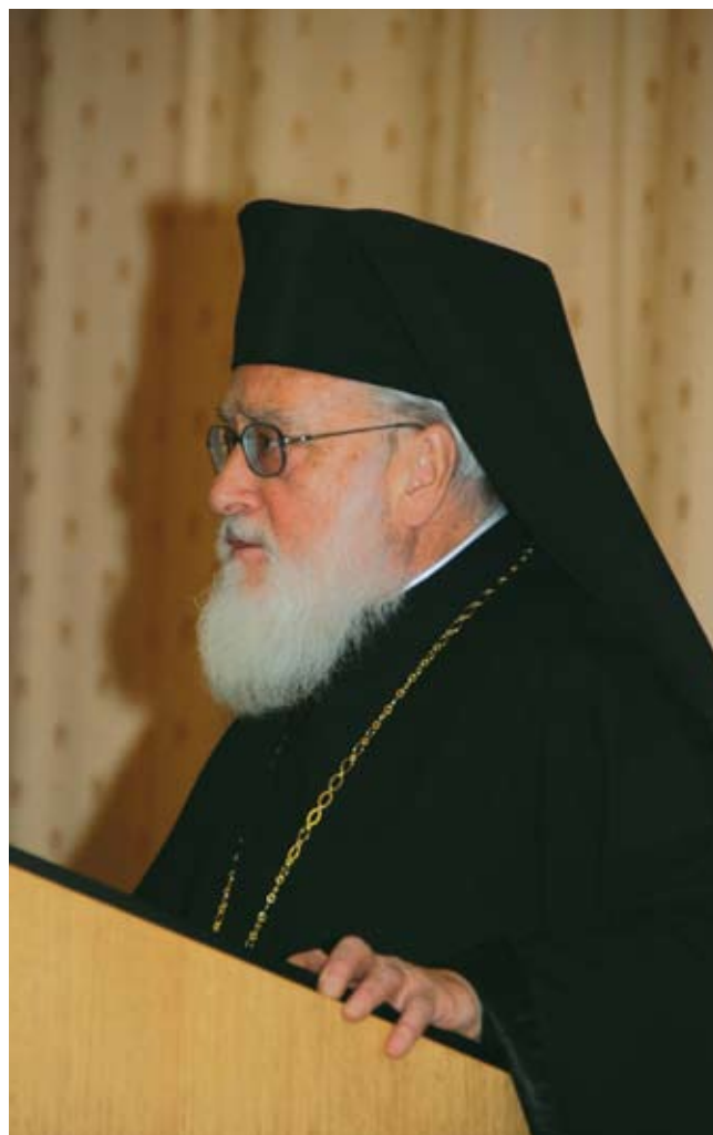
Митрополит Диоклийский Каллист (Уэр)

ветные корни православного учения о таинствах» он указал на то, что для выражения библейского понимания таинств необходимы оба термина, ибо православная сакраментология опирается на Священное Писание и вне его немислима. Таким образом, библейское богословие остается одним из необходимых оснований церковного учения о таинствах, равно как и любой другой области богословия. Докладчик привел те новозаветные тексты, которые позволяют говорить о том, что ныне совершающиеся в Церкви таинства восходят к новозаветной эпохе, подчеркнув, что «вся харизматическая жизнь Церкви как Тела Христова есть таинство в библейском смысле». В докладе также содержится