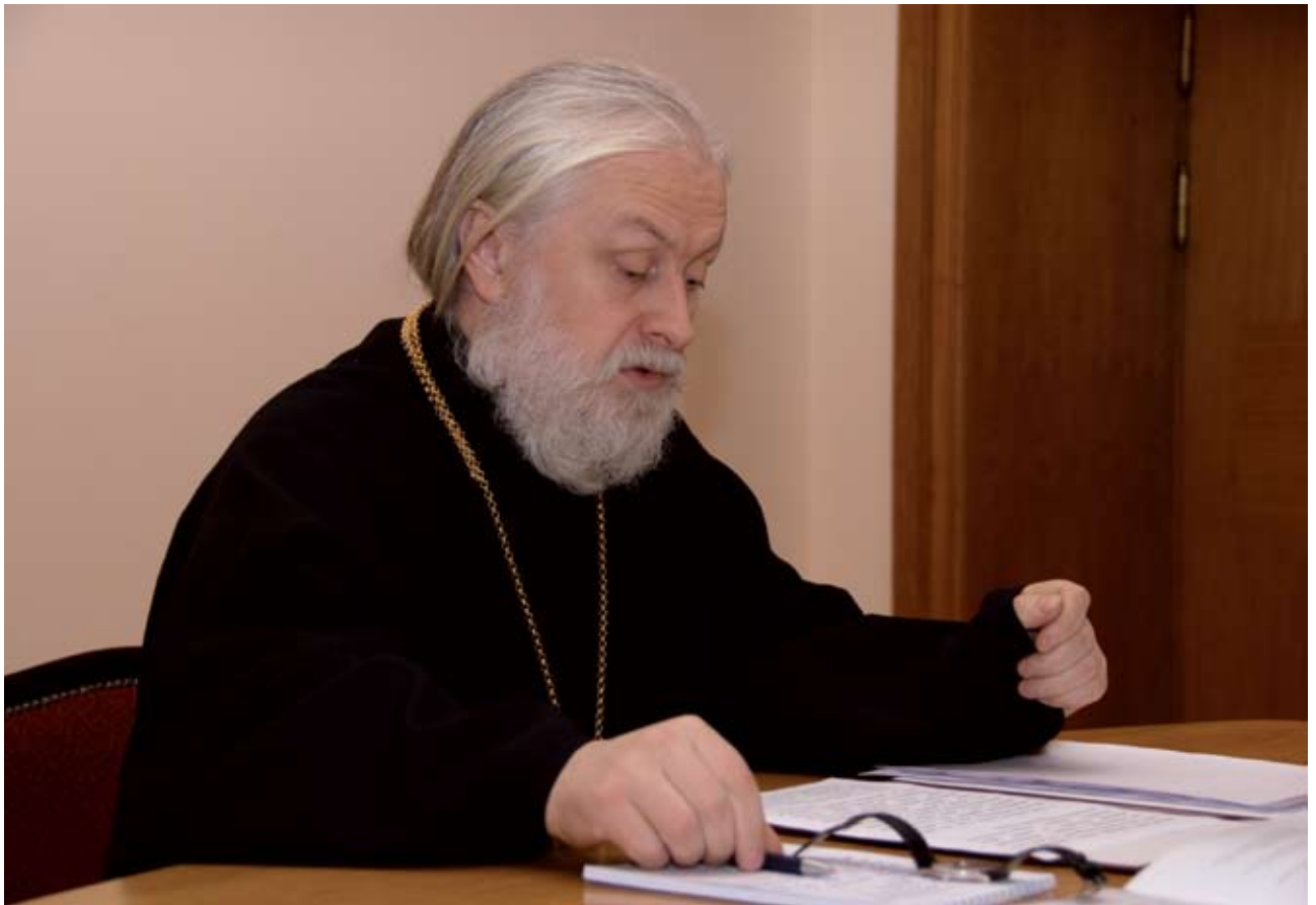
Архиепископ Верейский Евгений