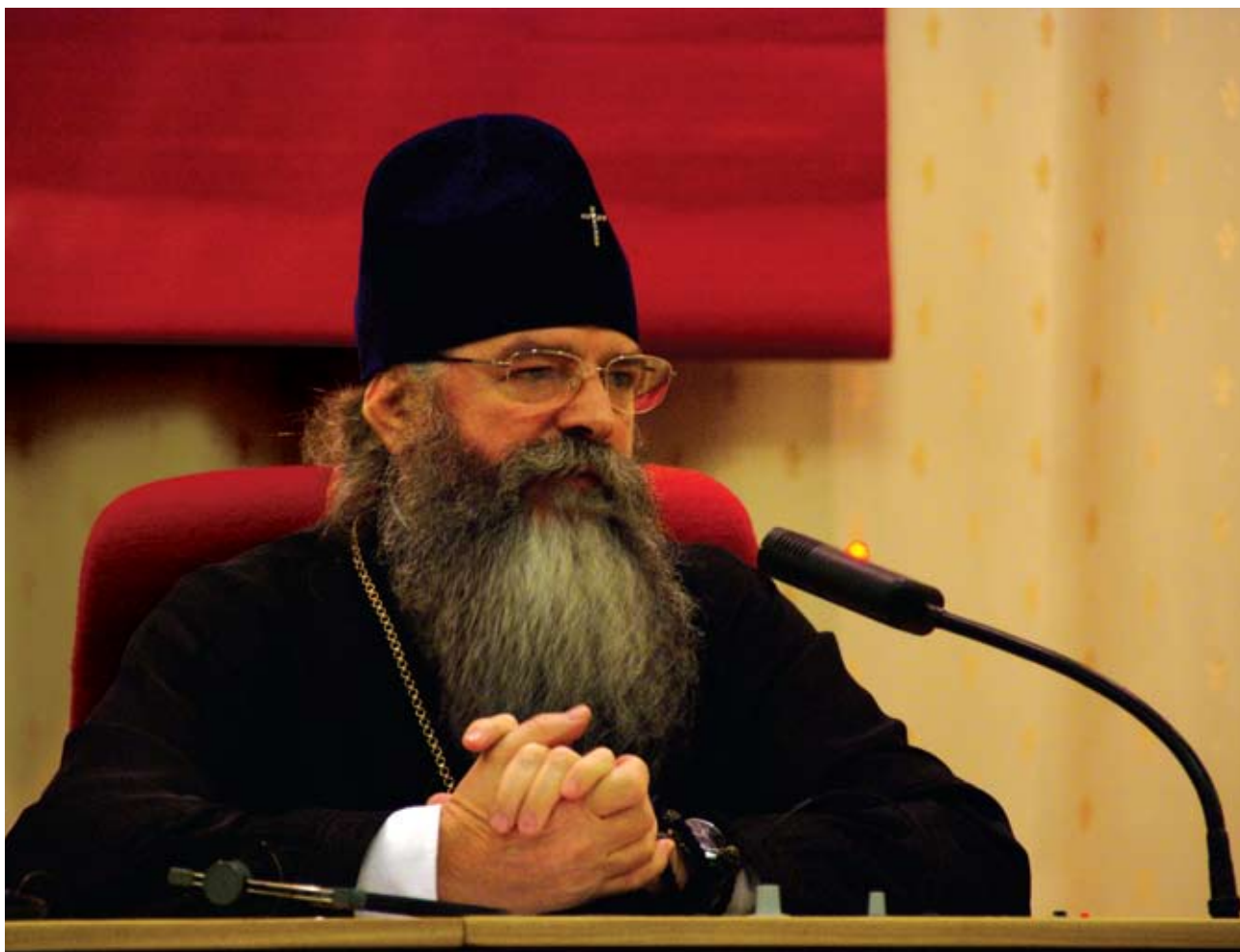
Архиепископ Тихвинский Константин