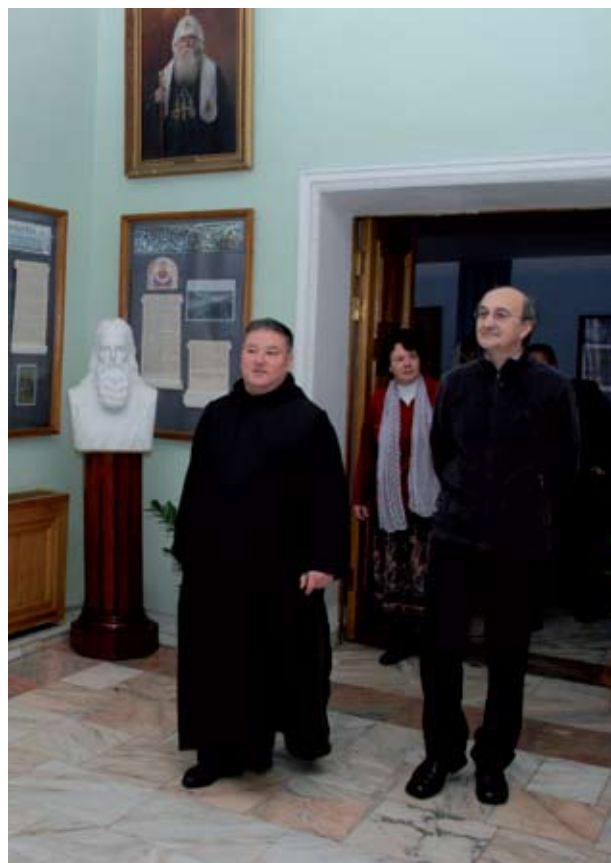
Проф. Хуан Аркас и проф. Серджо Убьяли