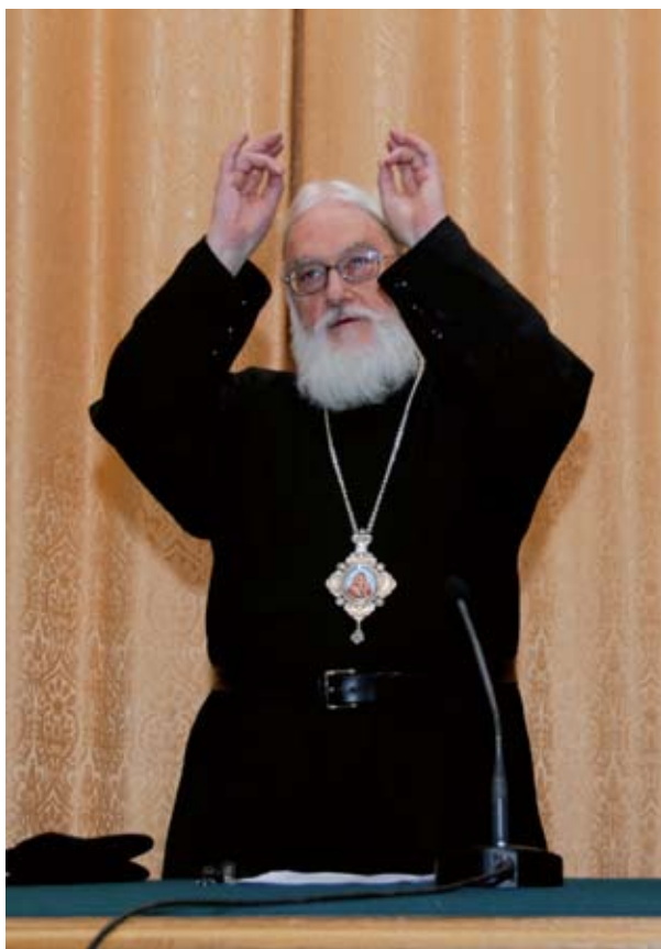
Митрополит Диоклийский Каллист (Уэр)